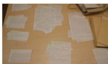
コード化のプロセス