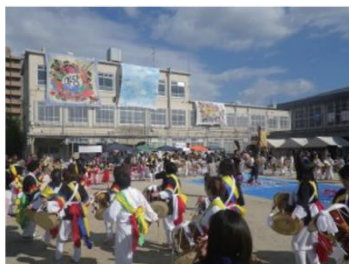
多文化共生の民族まつり