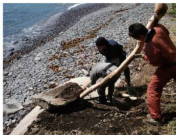
災害ボランティア