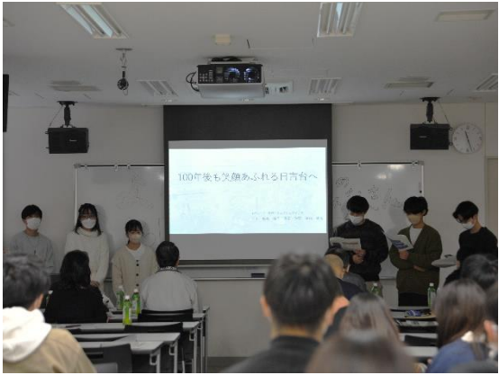
都市社会実践演習