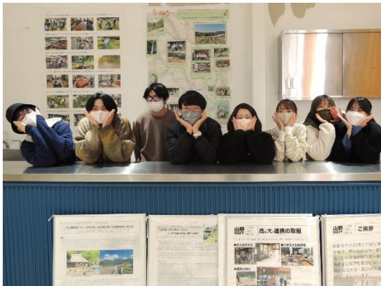
高大連携事業 （福山市立福山高等学校）