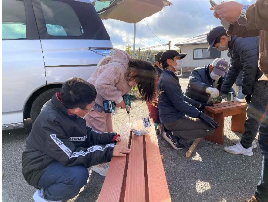
市民団体と連携した公園再生