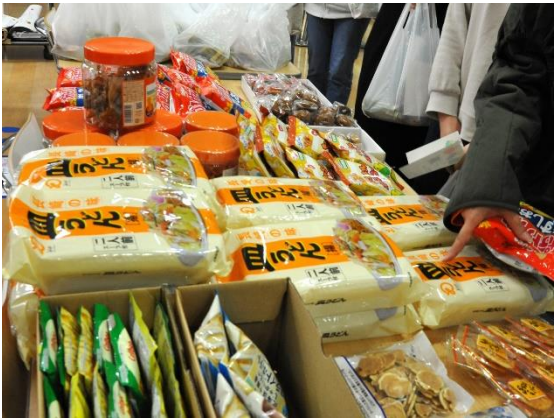
食べるボランティア