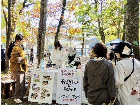
関係人口創出プロジェクト