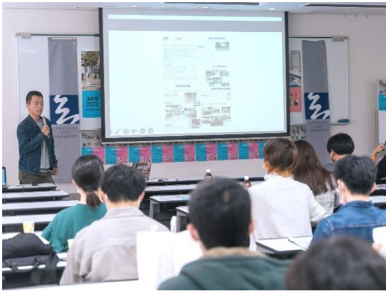
福山市立大学アイデアピッチ