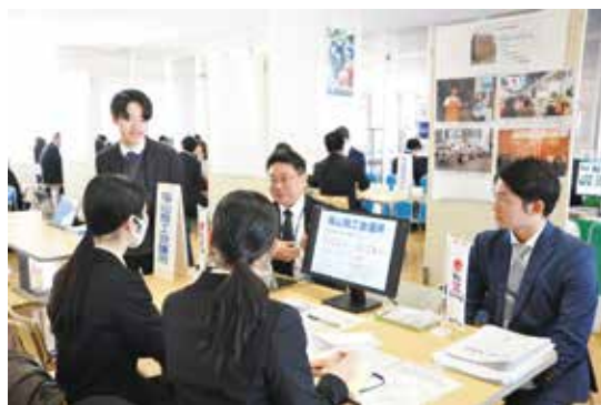
写真2：（左）学内合同企業説明会 開催について （中央・右）学内合同企業説明会 当日の様子