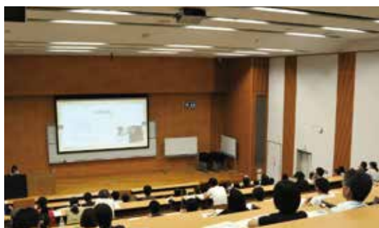
写真1：保護者説明会

こうした激変する就職戦線の実情などを保護者の方々にもご理解いただくことを目的に、昨年も7月に教育振興会の皆様方を対象とした「就職活動に関する保護者説明会」を開催させていただき、多くの方々にご参加いただきました（写真1）。さらに、3月には本学の学生のみを対象とした、全国また備後の「第一線の優良企業」68社による「企業合同説明会」を学内に会場を設けて対面で開催し、民間企業等への就職を目指す学生に、より充実した説明を受ける機会を創出してまいりました（写真2）。