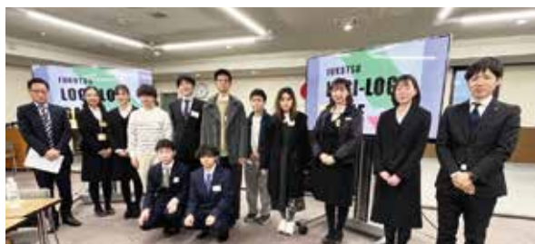
写真3：オープンカンパニー

さらに、社会人になって、社会的課題にむけて事業や組織を立ち上げることにむけて「アントレプレナーシップ研修」を初めて開設いたしました。ベンチャーやNPOの立ち上げ、また最近よく聞かれる企業内ベンチャーにむけて重視したものです。