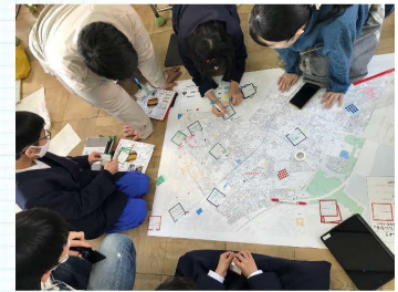
小学校のまちづくりクラブ (大阪府の公立小学校での協力例)