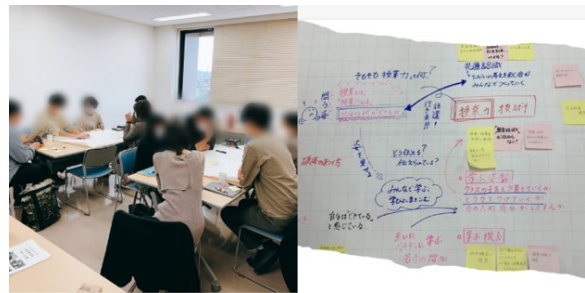
「ことばの教室づくりのための小さな勉強会」の様子