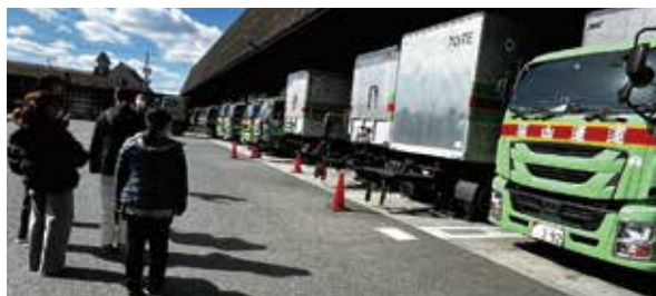
写真3：オープンカンパニー

学生が社会にはばたいた後、社会的課題に取り組むための事業や組織を立ち上げることを想定した「アントレプレナーシップ研修」を開設いたしました。ベンチャー企業やNPO、また最近よく聞かれる企業内ベンチャーの立ち上げに必要な社会人を養うことを目的としています。