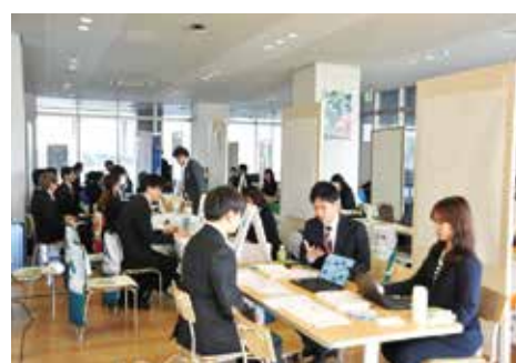
写真2：（左）学内合同企業説明会開催について （中央・右）学内合同企業説明会当日の様子