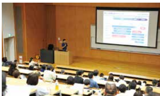
写真1：保護者説明会

昨年度の開催状況を一部ご紹介しますと、7月には就職戦線の実情などを保護者の方々にもご理解いただくことを目的に、教育振興会の皆様を対象とした「就職活動に関する保護者説明会」を開催し、多くの方々にご参加いただきました（写真1）。さらに3月には本学の学生のみを対象とした、備後さらには全国の「第一線の優良企業」74社による「合同企業説明会」を対面で開催し、民間企業等への就職を目指す学生により充実した説明を受ける機会を提供しました（写真2）。今年度も引き続きこうした取り組みを実施することを予定しております。