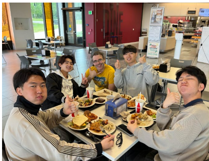
《大学のカフェテリアにて》