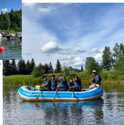
《チェナ川でラフティング》