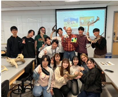
《「アラスカの哺乳類」の講義》