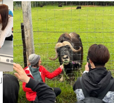
《ジャコウウシの見学》