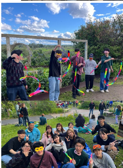
《大学内植物園で野外コンサート》