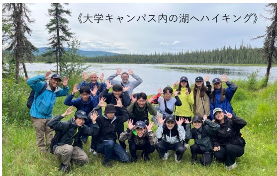
《大学キャンパス内の湖へハイキング》