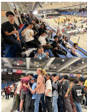
《World Eskimo Indian Olympicsにて》