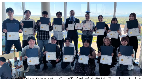
《Graduation Dinnerにて。修了証書を受け取りました！》