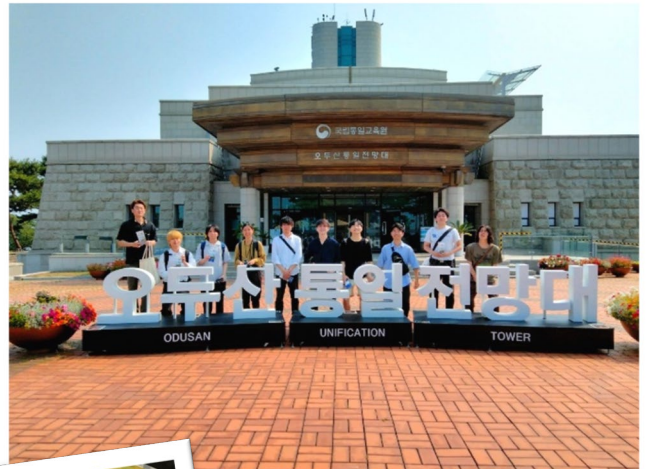
《鳥頭山(オドゥサン)統一展望台にて》