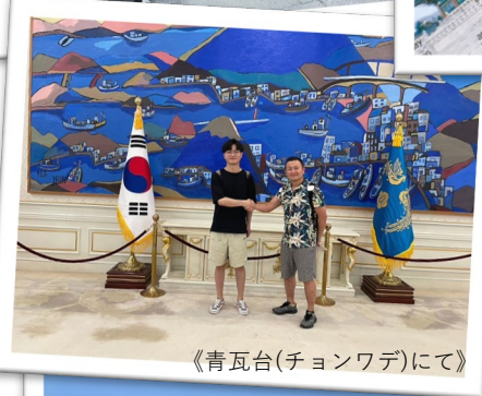
《青瓦台(チョンワデ)にて》