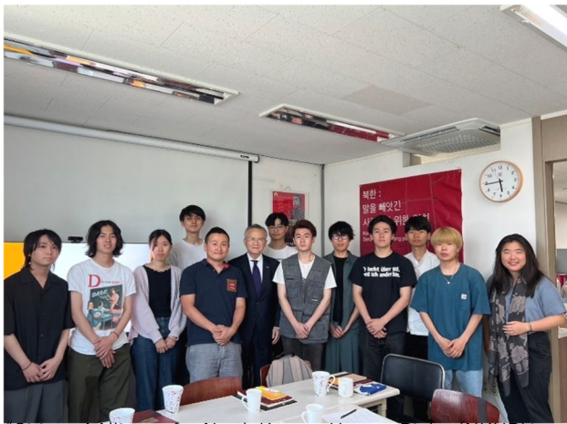
《Citizens' Alliance for North Korean Human Rights(NKHR)にて》

分断と統一をめぐる朝鮮半島の現状について、延世大学や北韓人権市民連合、DMZなどを訪問し、歴史・人権・国際関係の視点から平和構築の課題と可能性を学ぶ。