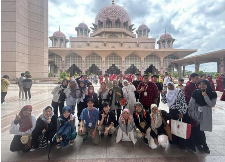
《ピンクモスクを訪問》

マレーシアイスラム科学大学 (USIM) で現地の文化や生活を体験しながら、英語を学ぶ。USIM の学生バディと共にフィールドワークを行い、文化交流を行う。