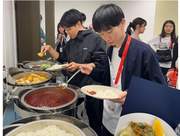
《スクールカフェテリアにて》