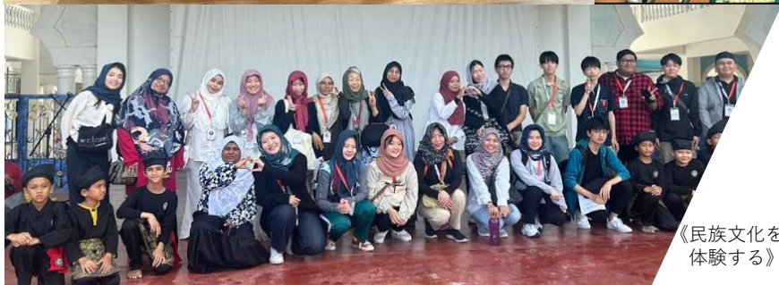
《民族文化を 体験する》