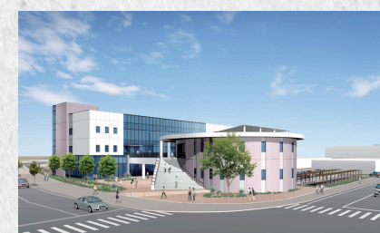
2024年（令和6年）～小松安弘記念館