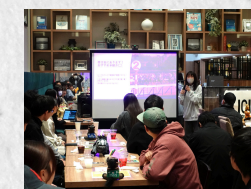
学生ゼミによる地域連携事業