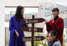
福山市との連携事業 ～バラ花壇の看板設置～