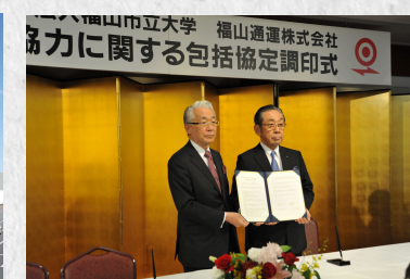
地元企業との連携協定