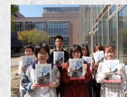
福山市との連携事業 ～パンフレット制作～