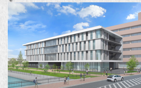
新棟完成予想外観図

福山市立大学は、地域ニーズや社会情勢を踏まえ、 情報工学部情報工学科（仮称） を