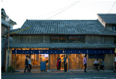
塩や(空き家の利活用)2017

空き家や廃校などの空き公共施設のほか、歩道や公園といった未利用空間の利活用について研究しています。対象の現況を把握し、その地域の「これから」と対照して利活用について検討します。多くの場合は、「公共的」な利活用が志向されるため、地域や行政の方々との対話（コミュニティ形成）を通してビジョンを模索し、この過程の中で具体的に利活用するための運用方法なども合わせて検討します。一連の過程を論文などにまとめて社会に還元していますが、実際に場所を形成するなど、具体的に利活用することを目標として取り組んでいます。