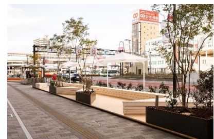
まちよーる(歩道空間利活用、木質交流スペース)2022