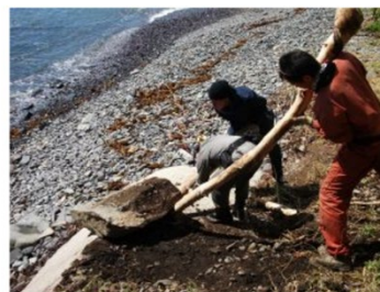
災害ボランティア