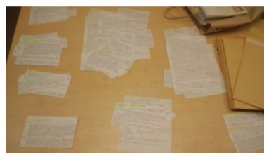
コード化のプロセス