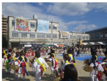
多文化共生の民族まつり