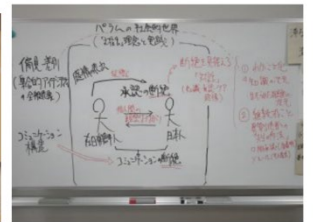
理論化のプロセス