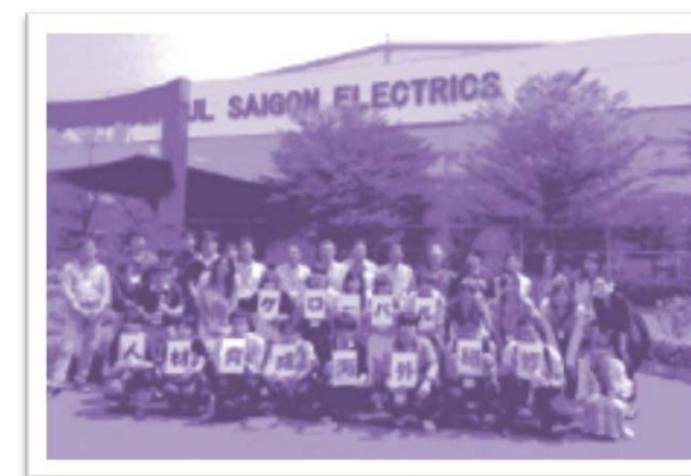
ベトナム サンエス電子工場にて