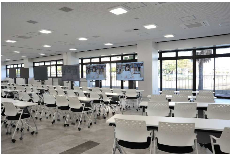
会場: 小松安弘記念館1階講義室A・B